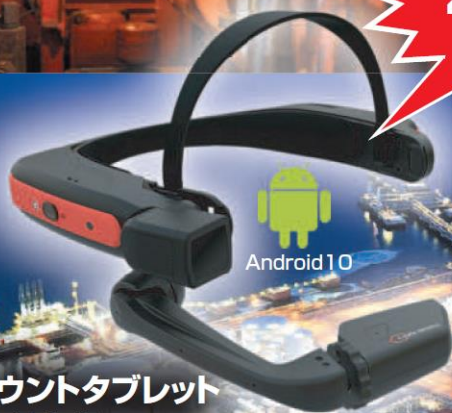
防爆ヘッドマウントタブレット HMT-1Z1