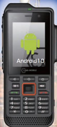
防爆デジタル通信端末 IS330.1